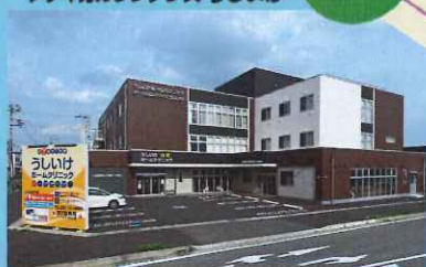
群馬県前橋市元総社町1770-4

医療や介護が必要でも安心して、 暮らし続けられる住まいの提供 メディカルレジデンス うしいけ