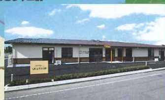
群馬県北群馬郡 榛東村大字新井字 十二前2224-4