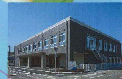
群馬県前橋市総社町総社2628